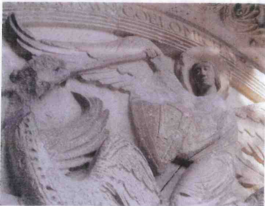
L'église romane de Saint-Michel-d'Entraygues est quasiment unique en France.

D'Angoulême à Cognac, la Charente déroule au fil de l'eau ses paysages aux collines bucoliques et ponctuées d'églises romanes.